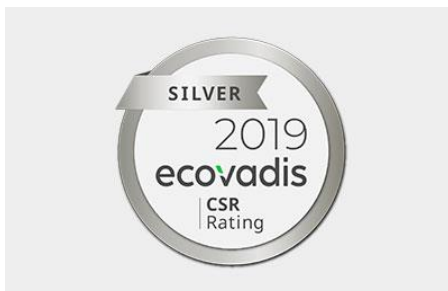
EcoVadis Silver Rating

www.mercateo.com/corporate/presselounge/pressemitteilungen/