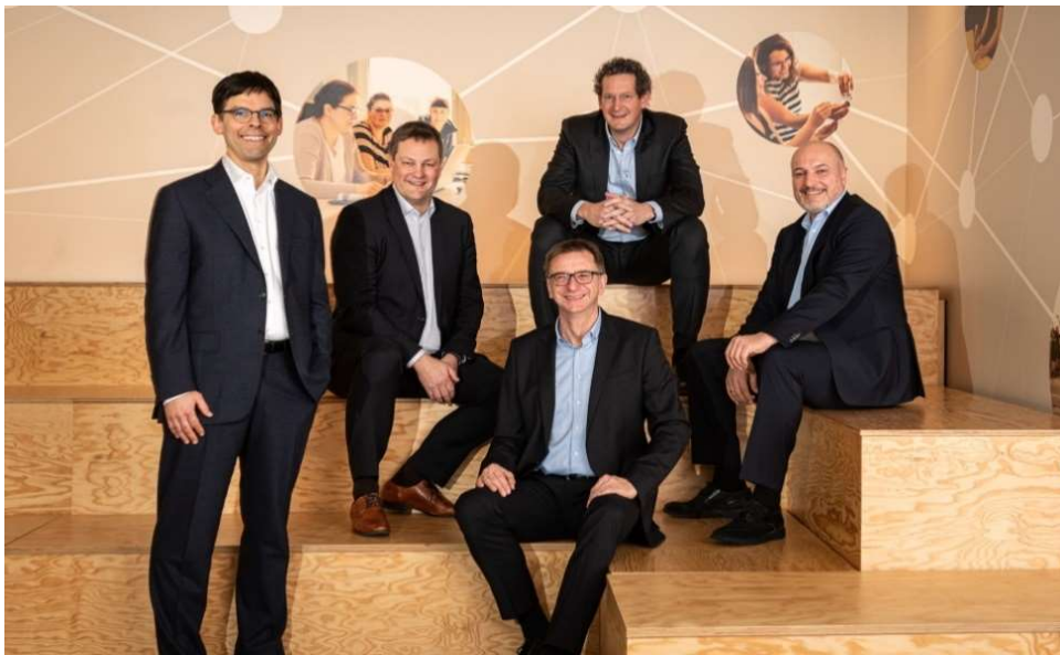
Die Mercateo Geschäftsführung.